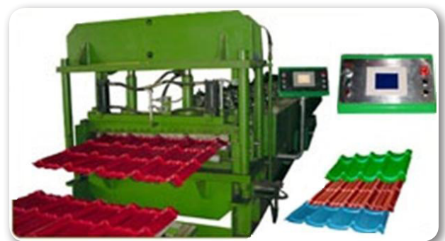
MÁY CÁN TÔN SÓNG NGÓI