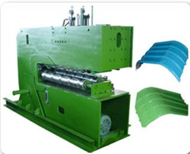
MÁY CHẤN VÒM THỦY LỰC