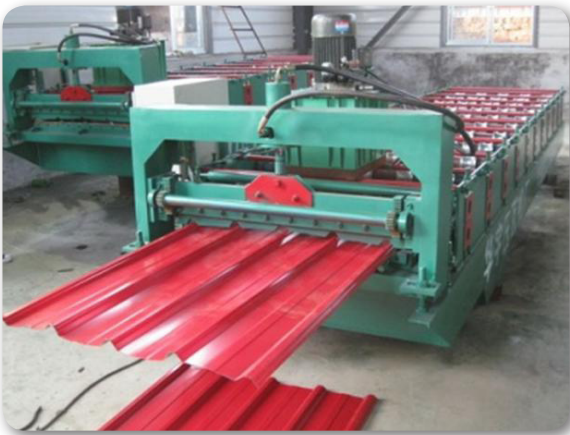
MÁY CÁN TÔN (01 TẦNG – 02 TẦNG)