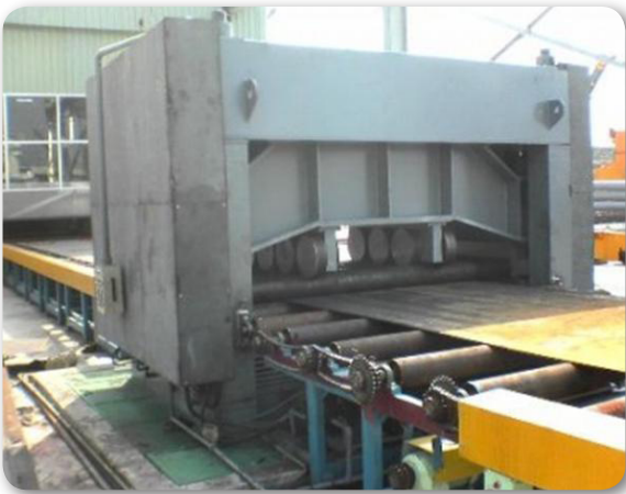
MÁY CHIA CUỘN THÉP – INOX (XẢ BĂNG)