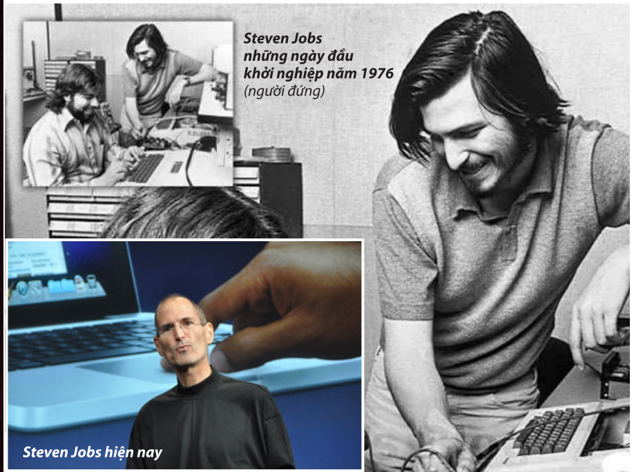
Steven Jobs hiện nay

không bỏ học và không học khóa học viết chữ đẹp thì tất cả các máy tính cá nhân bây giờ có thể chẳng có được chúng”.