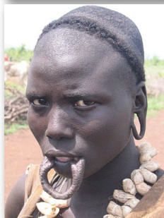
Môi khi lấy đĩa ra