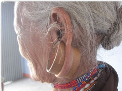
Đầu ngà voi đã được thay bằng những ống nứa.