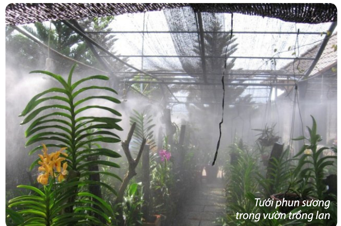
Tưới phun sương trong vườn trồng lan