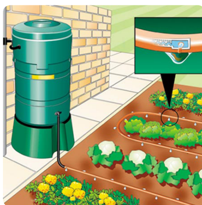
Hệ thống tưới nhỏ giọt

Giá tham khảo: giá máy móc thiết bị: 32.000 VNĐ/m 2 .