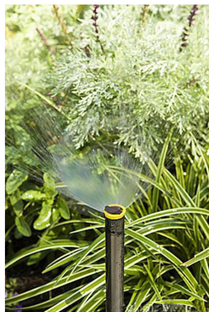
Tưới phun mưa

Giá tham khảo: giá máy móc thiết bị: 25.000 VNĐ/m 2 .