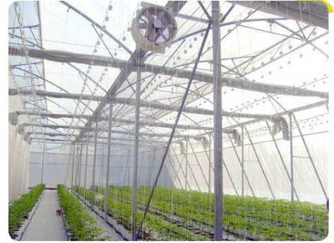
Trồng cây trong nhà kính có trang bị hệ thống tưới phun sương

Giá tham khảo: giá máy móc thiết bị: 40.000 VNĐ/m 2 .