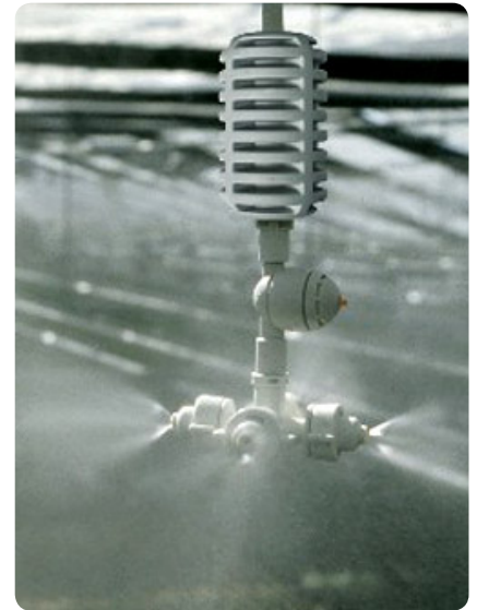
Thiết bị tưới phun sương

Giá tham khảo: Giá máy móc thiết bị: 500.000.000 VNĐ/1 hệ thống.