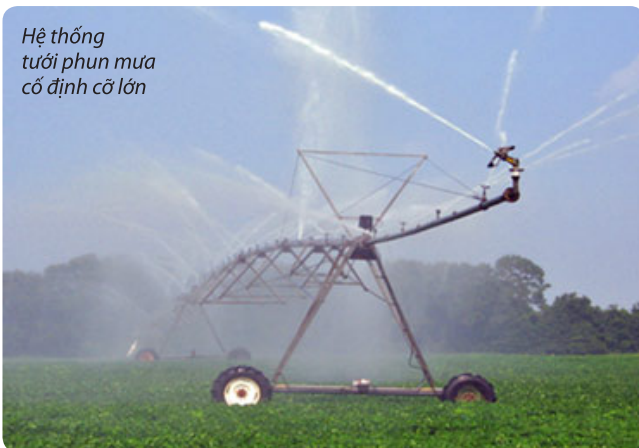
Hệ thống tưới phun mưa cố định cỡ lớn

Giá tham khảo: giá máy móc thiết bị: 200.000.000 VNĐ/1 hệ thống