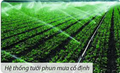
Hệ thống tưới phun mưa cố định

Giá tham khảo: giá máy móc thiết bị: 55.000 VNĐ/m 2 .