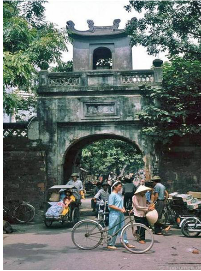
Ô Quan Chưởng: một trong năm cửa ô của Hà Thành, và là cửa ô duy nhất còn giữ lại được dáng vóc xưa của nó.