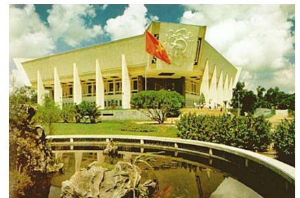
Bảo tàng Hồ Chí Minh

Năm 1990, nhân kỷ niệm 100 năm Ngày sinh của Người, ở Quảng trường Ba Đình, một công trình kiến trúc lịch sử được ra đời, đó là Bảo tàng Hồ Chí Minh, nằm bên trái, phía sau Lăng Chủ tịch Hồ Chí Minh và kề sát chùa Một Cột.