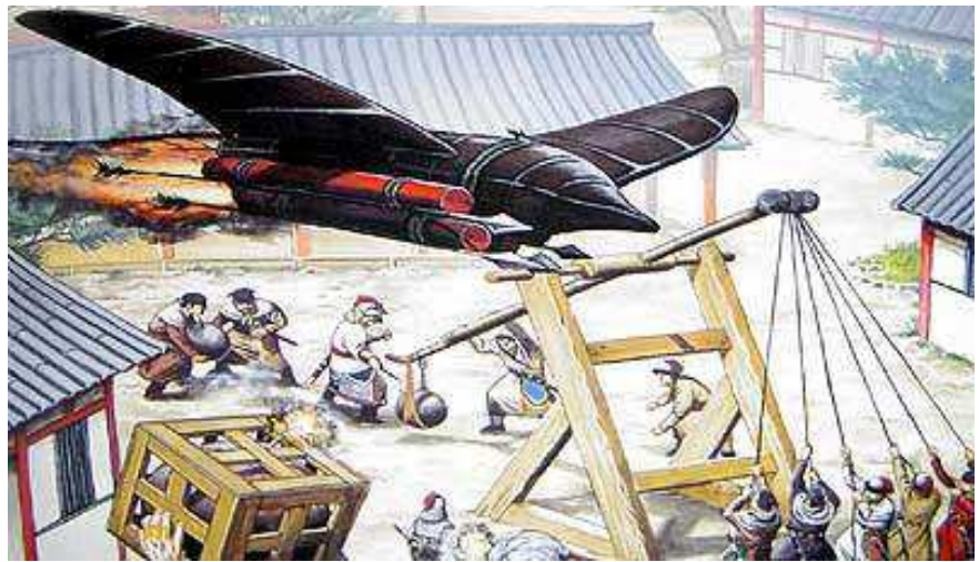
Chim lửa xuất hiện từ thế kỷ 15 tại khu vực Đông Bắc Á - ông tổ của loại tên lửa hành trình/ có cánh ngày nay

Hỏa long túc thủy: rồng lửa bắn từ dưới nước (Huolong Chushui), là một ống tre dài chừng 1,5 mét, phía trước và sau gắn đầu và đuôi rồng, miệng chỉ lên trời, bên trong chứa thuốc súng, hai bên họng và bụng gắn bốn quả tên lửa nhỏ chung ngòi. ở giai đoạn 1, sau khi hai quả phía trước nổ thì hai quả phía sau bắt đầu kích hoạt nổ theo, khi chúng cháy hết và rơi xuống sẽ kích nổ phần thân